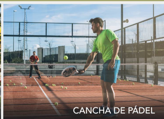
CANCHA DE PÁDEL