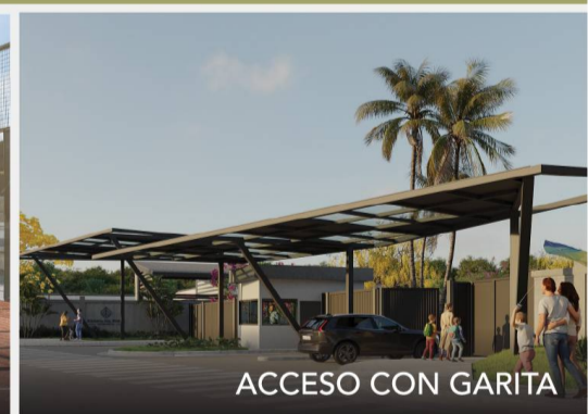
ACCESO CON GARITA